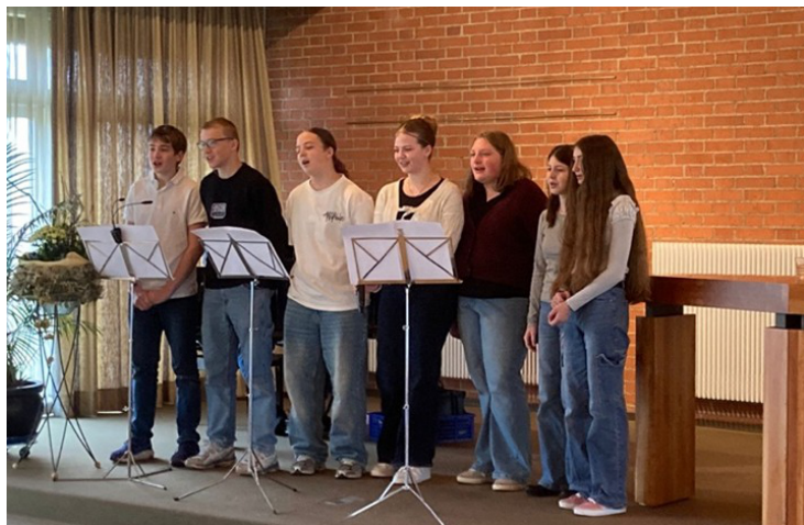
Eine Präparandin und zwei Präparanden fehlen auf dem Bild.

Am 15. Februar fand in unserer Kirche der Präparanden-gottesdienst unter dem Titel „Wir und die Arche Noah“ statt. Zehn Präparandinnen und Präparanden gestalteten diesen besonderen Gottesdienst mit viel Engagement, Kreativität und Mut.